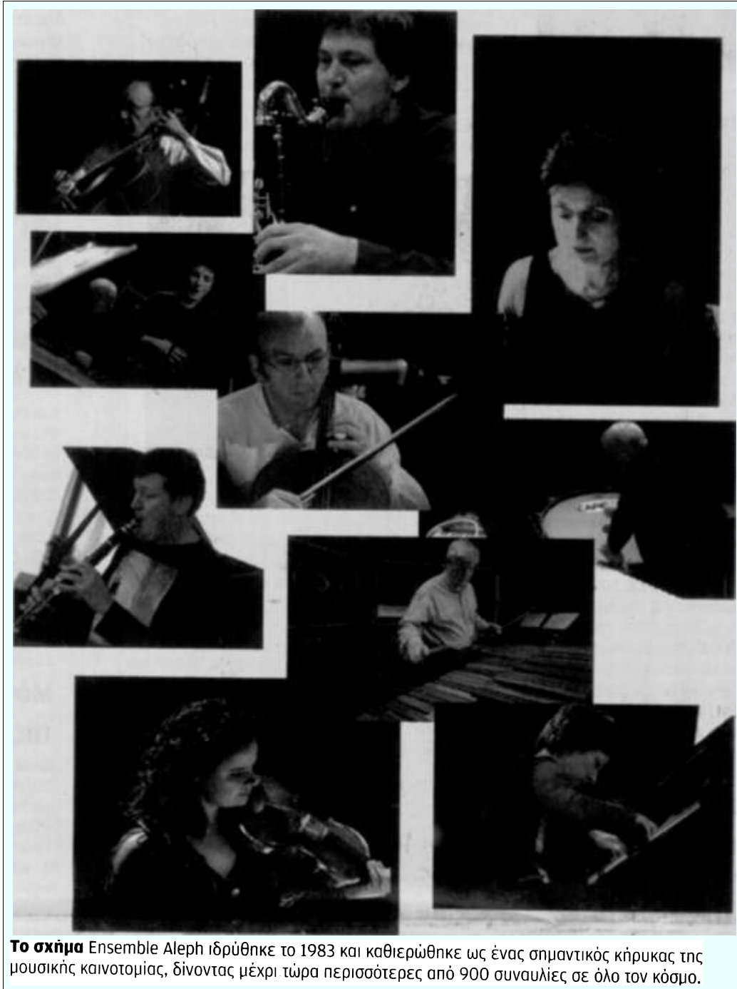
Το σχήμα Ensemble Aleph ιδρύθηκε το 1983 και καθιερώθηκε ως ένας σημαντικός κήρυκας της μουσικής καινοτομίας, δίνοντας μέχρι τώρα περισσότερες από 900 συναυλίες σε όλο τον κόσμο.

Η ΚΑΘΗΜΕΡΙΝΗ ΤΕΧΝΕΣ ΚΑΙ ΓΡΑΜΜΑΤΑ Κυριακή, 9 Σεπτεμβρίου 2012, π. 1