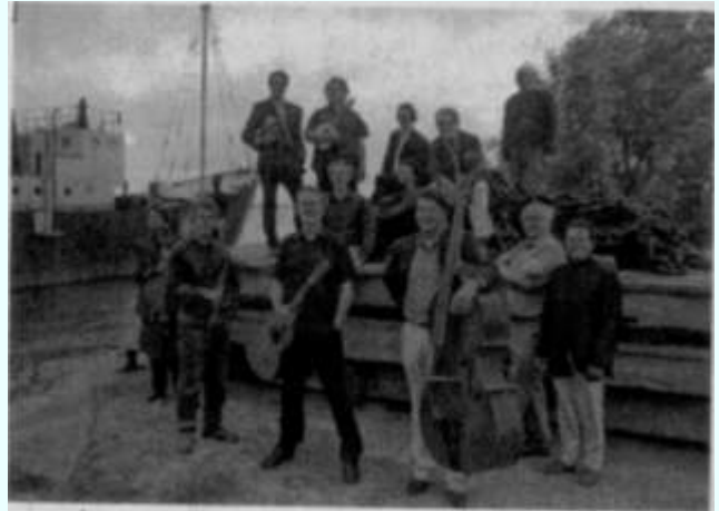
Το σχήμα Nieuw Ensemble.