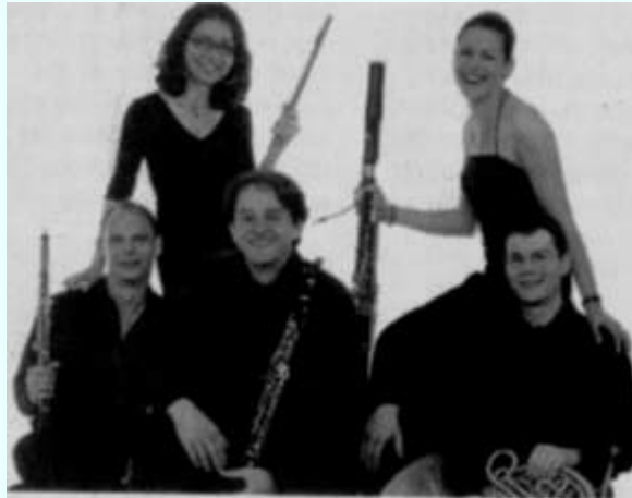
Το Κουιντέτο Πνευστών Arirang

μα και τα υλικά της σκηνής όπου παίζουν. Η ονομασία του Κουαρτέτου είναι εμπνευσμένη από τον Καιρό, τον νεότερο γιο του Δία, θεό της ευσιώνης στιγμής στην αρχαία ελληνική μυθολογία. Σε αντιπαράθεση με τον Χρόνο, αποτελεί μια έννοια της χρονικής στιγμής που συνδέεται στενά με την ανθρώπινη εμπειρία. Ως μουσικός μπορεί κανείς να αισθανθεί τον «Καιρό», όταν αυτό που επιτυγχάνεται είναι η τέλεια αρμονία μεταξύ όλων των συμμετεχόντων. Αυτές οι σπάνιες και μαγικές στιγμές είναι ο απώτερος στόχος όλων των καλλιτεχνών που εργάζονται με τον χρόνο. Η συναυλία του Κουαρτέτου Εγχόρδων Kairos πραγματοποιείται σε συνεργασία με το Ινστιτούτο Γκαίτε Κύπρου.