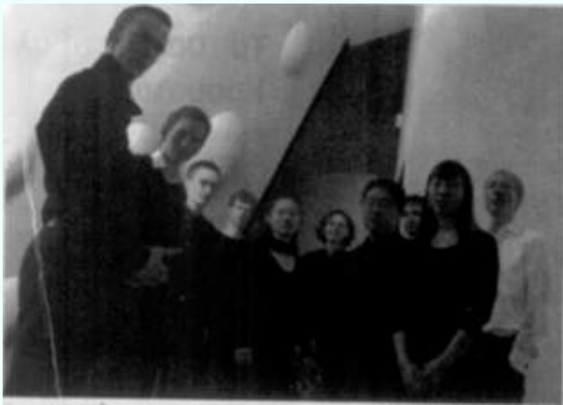
Το συγκρότημα El Perro Andaluz